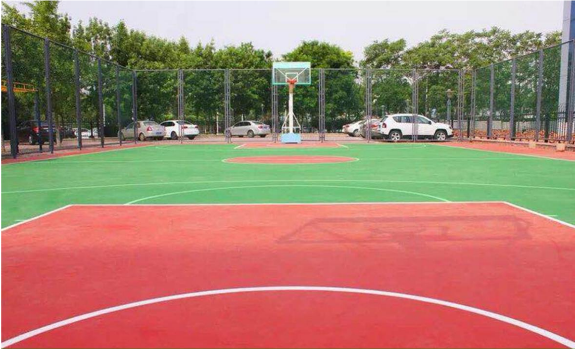
焕然一新的员工篮球场