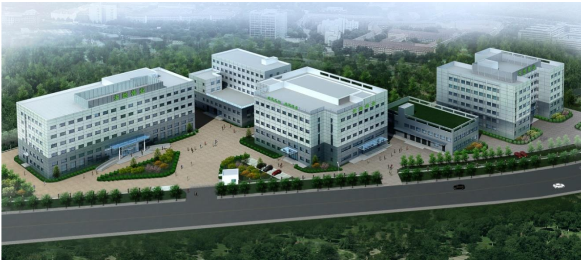
图 1 天地伟业研发基地

天地伟业技术有限公司是全球领先的智能安防解决方案提供商,基于人工智能、大数据、云计算、物联网等技术,为公安、政法、交通、金融、教育、环保等行业提供智能视频产品、系统解决方案及优质技术服务。天地伟业以“视界为世界”作为企业使命,产品远销全球 60 多个国家和地区,是全球安防前 10 强。公司在全国设立 60 余个分支机构和服务中心,连续十六年荣膺“中国安防十大品牌”,产品应用在北京天安门、中国运载火箭试验中心、达沃斯论坛,伦敦希斯罗机场、公安部监管中心、中国农业银行总部,以及天津、上海、西安、郑州、厄瓜多尔首都、塔吉克斯坦首都等 500 多个智慧城市。