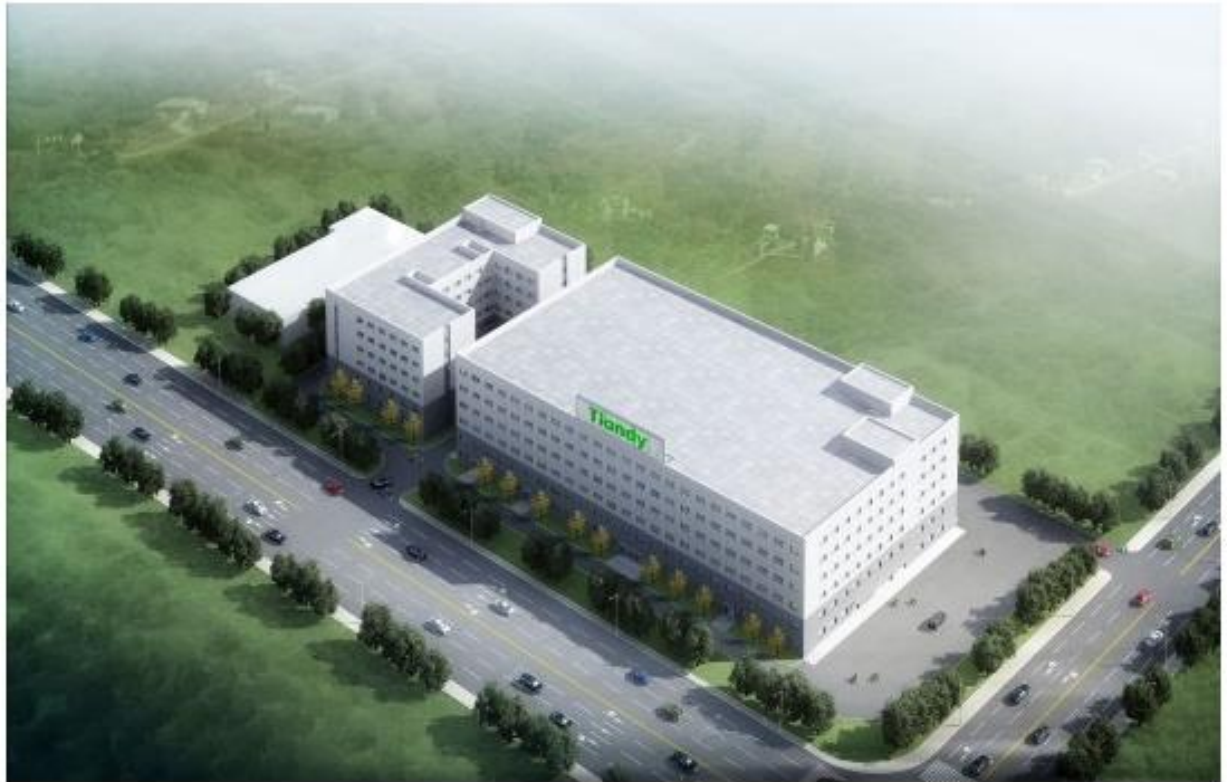
图 2 天地伟业技术有限公司生产基地